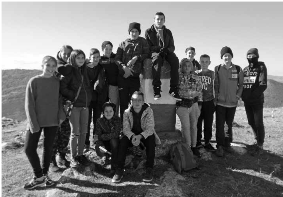
A Székely-kő csúcsán