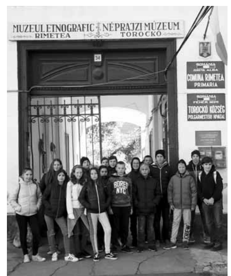
Néprajzi múzeum Torockón