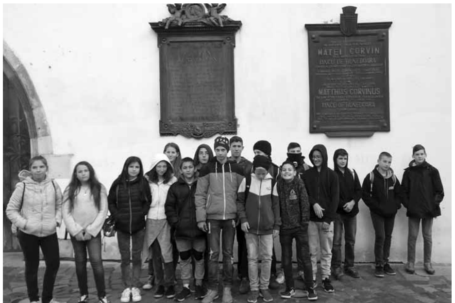
Mátyás szülőháza előtt

Zilah és Érmindszent még belefért a programba, hiszen Ady Endre szülőfaluját sem akartuk kihagyni. Érdekes, hogy a falut ma már hivatalosan Ady Endrének hívják.