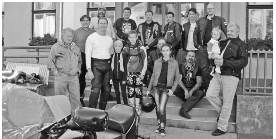
Gyöngyöstarjáni Motoros Baráti Kör