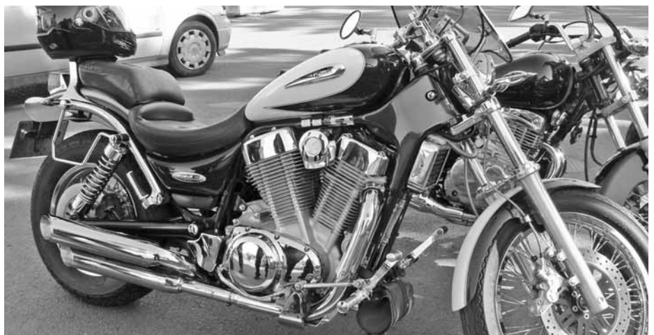
Egy a szépségek közül