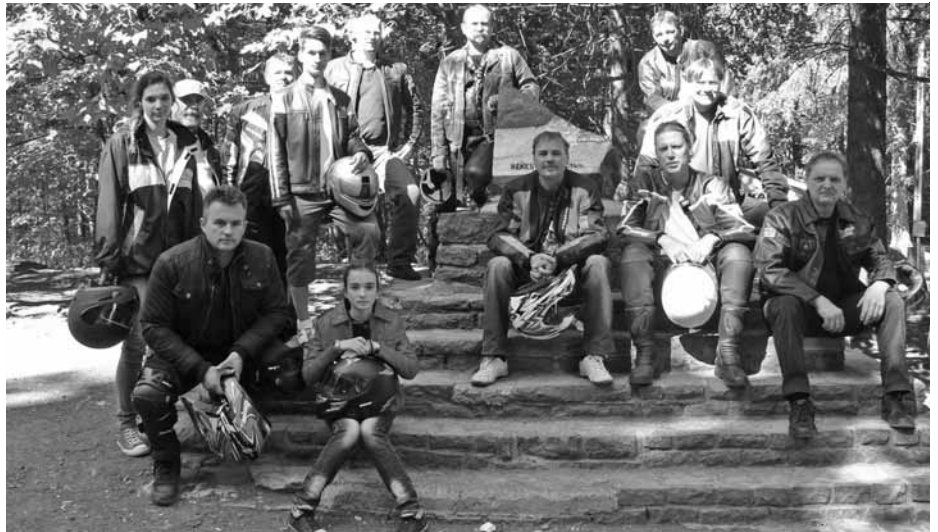
Gyöngyöstarján a csúcson! Kékestető