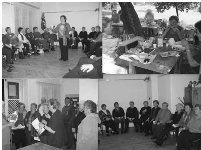
Nagyi Klub II. félévi programja